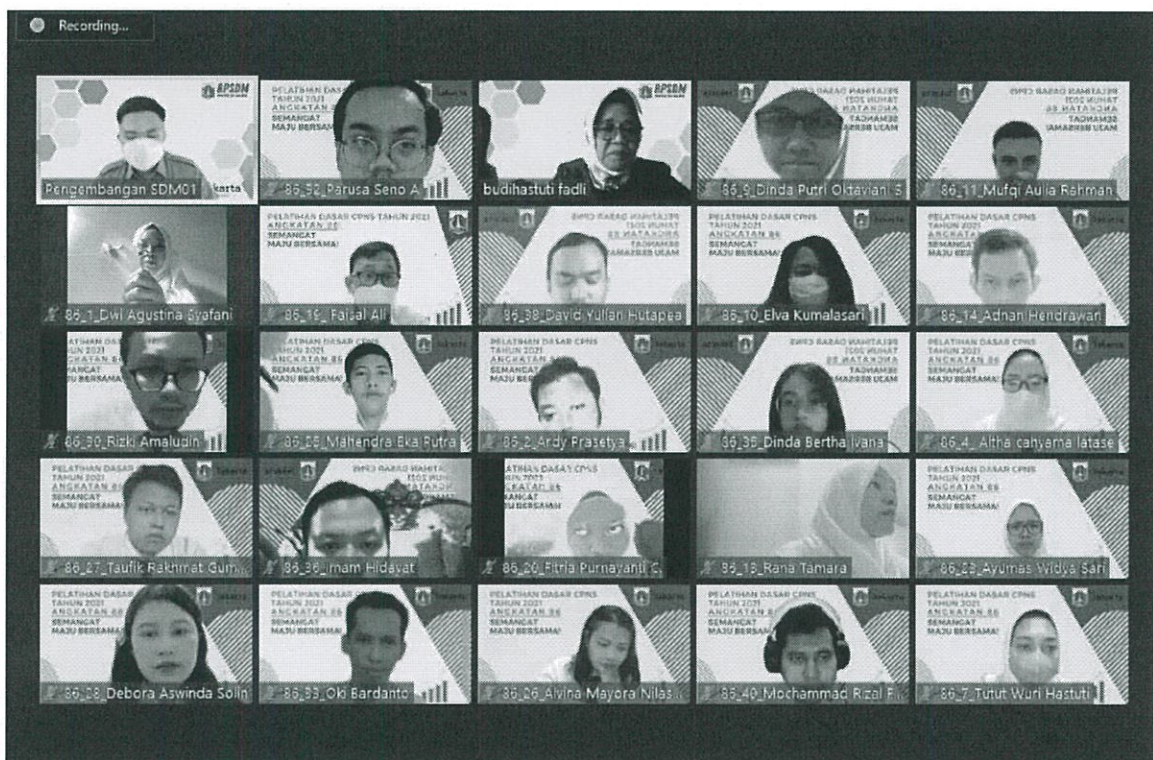
Foto-foto Kegiatan Synchronous (minimal 6 foto dan menampilkan semua peserta + tutor)